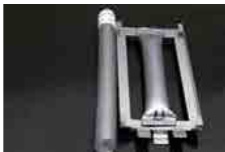
Campione a zero ore (prima dell'esposizione) e campione sottoposto al test di invecchiamento accelerato dopo 4.000 ore di esposizione.

La prova prevede una durata di 4.000 ore di esposizione in un weatherometro con lampada allo Xenon Cl65 che equivalgono in Kly, a circa 3 anni di esposizione continua in Italia Settentrionale o 2 anni nel Sud Italia.